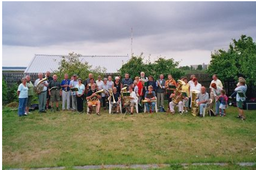
Gruppenfoto mit den Esten